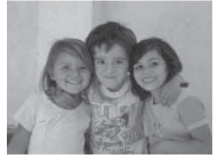
Tres amigos, Comunidad las Calles, Argentina

SDIA's Network eNews (ingles) / Noticias de la Red Susila Dharma Internacional (español)— nuestro principal método de compartir información acerca de las actividades de la red- se produce mensualmente. En 2007 fueron distribuidos trece boletines en inglés y en español.