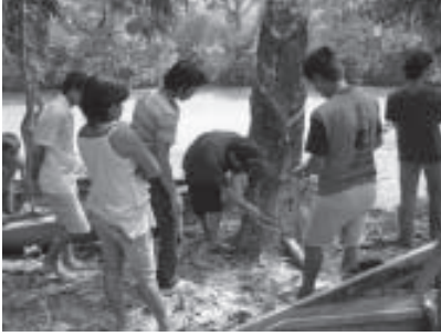
Aprendiendo sobre el cultivo del árbol de caucho, YTS, Kalimantan