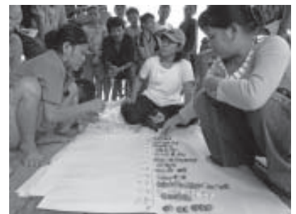
Plan Comunitario PRA , Proyecto YTS, Kalimantan