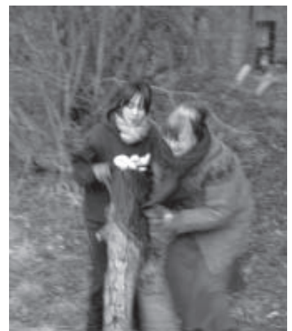
Reunión de trabajo voluntario, SD Gran Bretaña