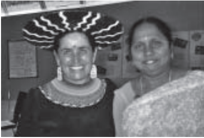
Uraida, Inka Samana, Ecuador & Fundación Bella, Mithra, India