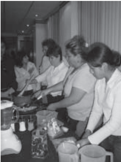
Programa nutricional Asociacion Vivir, Ecuador