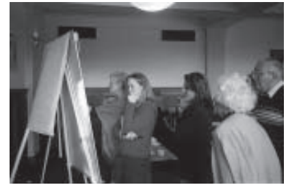
Reunión de la Red en Lewes, Reino Unido, Enero de 2007

Europa: Sun For Life (activa en Madagascar).