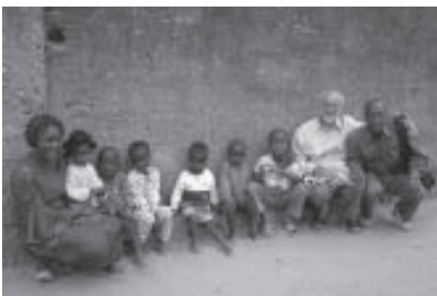
Construcción de la Escuela Alabadi, RD del Congo