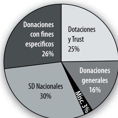
INGRESOS DE LA SDIA 2007 (TOTAL $200,013)