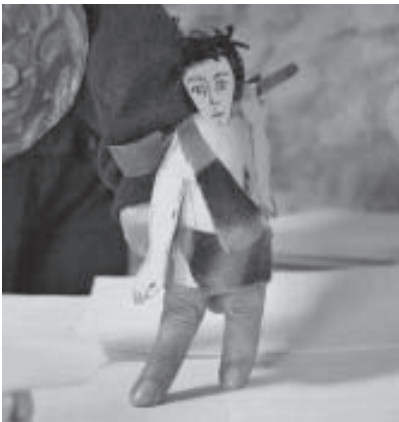
"Cain slays Abel" (Caín mata a Abel), Titiriteros sin Fronteras, Francia