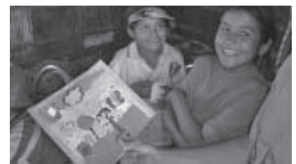
My Neighborhood (Mi vecindario), Estados Unidos