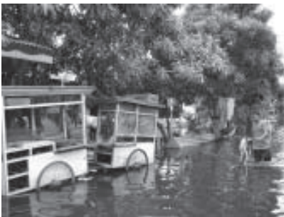
Inundaciones en Jakarta, Febrero 2007